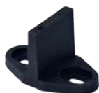
1 guide porte