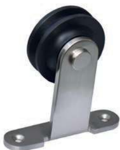
2 montures à galets en polyamide à roulement à billes avec penture de fixation sur chant