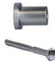
5 vis et systèmes de fixation pour mur plein

Avant la pose, vérifier la possibilité de montage sur doublages ou murs creux. Utilisation à l'intérieur.