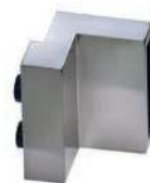
2 butées d'extrémité