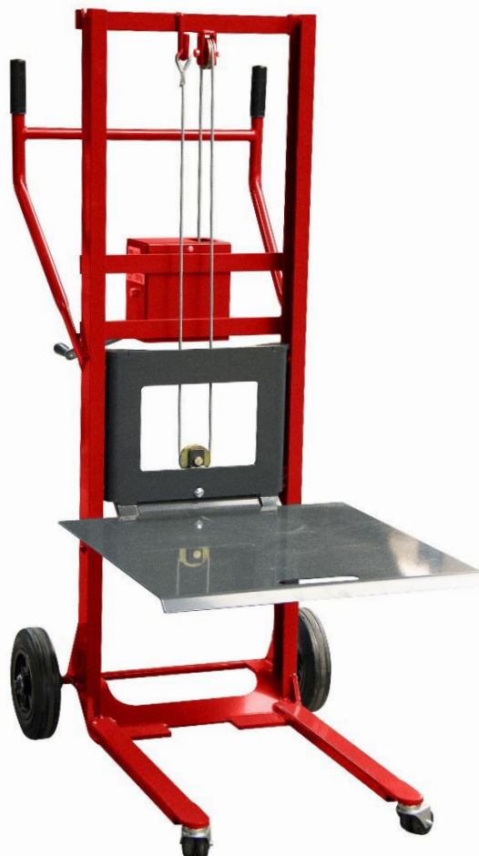
855 000 650 avec option 855 006 152