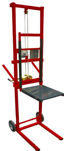
Modèle CU 100-150 kg

Levée 1750 mm et CU 100 kg avec rallonge déployée