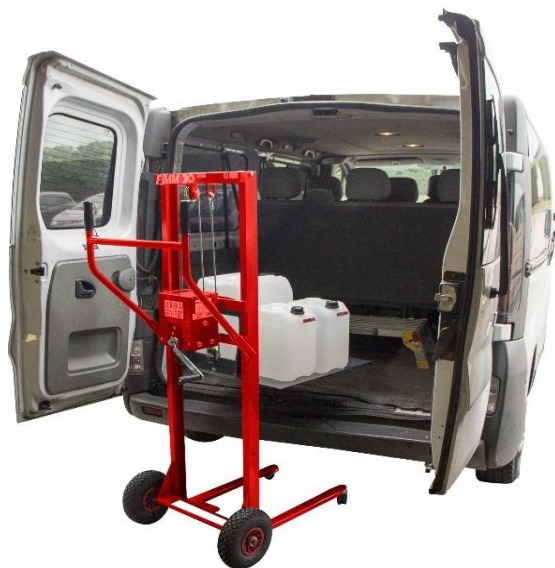
855 000 651 avec option 855 006 152