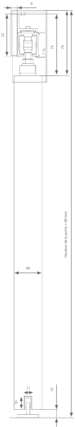
Option 1 - Version A