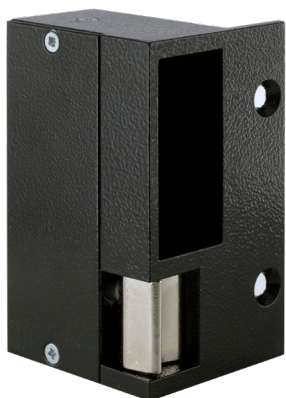
➤ Gauche tirant DIN Droite (2)

Noir en standard. Gris ou marron sur commande