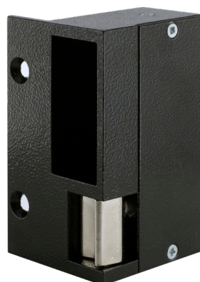
➤ Droite tirant DIN Gauche (2)