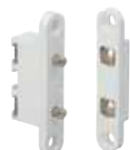
Contacts à pression p. 792