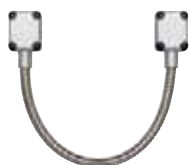
Flexibles inox p. 792