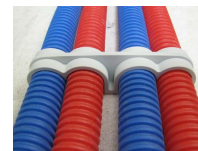
FIX-RING Quadruple - vue en situation