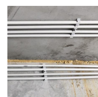
FIX-RING Multi électricité - tube IRO