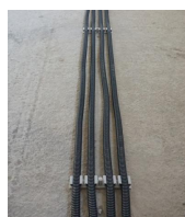
FIX-RING Multi électricité - gaine ICT