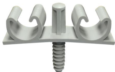
FIX-RING Multi électricité double