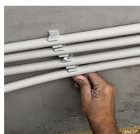
FIX-RING Multi électricité - clipsage à la main