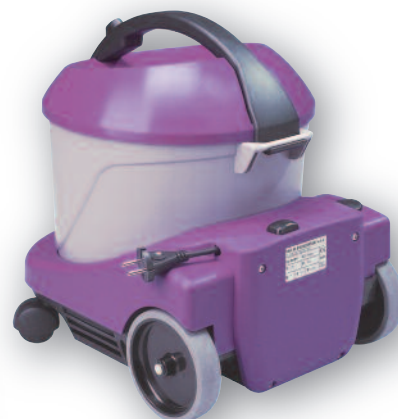
Enrouleur automatique de câble