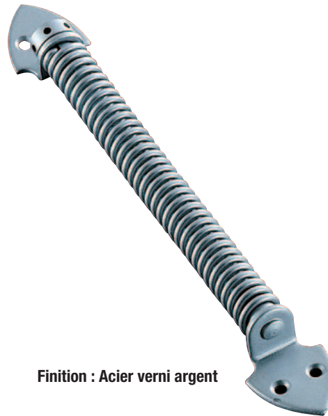
Finition : Acier verni argent

Ferme-porte mécanique, ferme la porte en la poussant