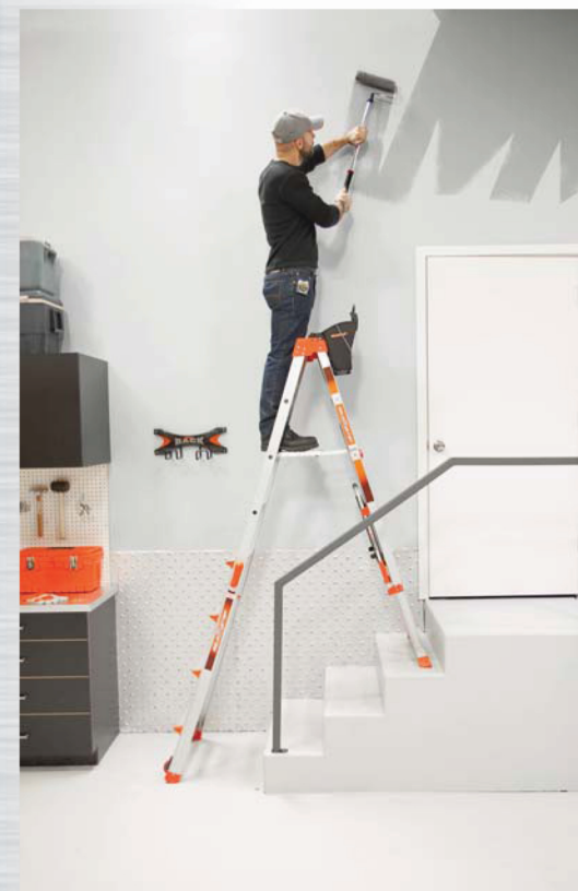
Position dans les escaliers