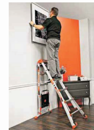
Position 90° contre un mur