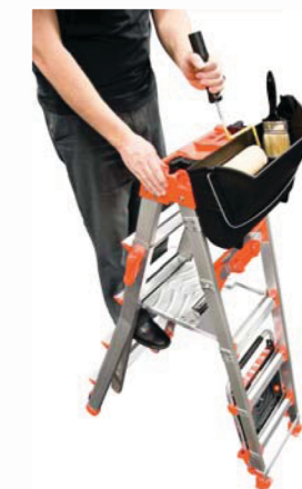
Utilisation de l'accessoire Fuel Tank™