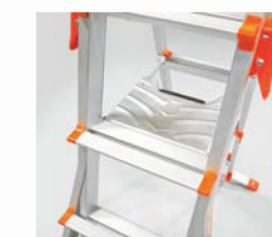
Le Comfort Step™