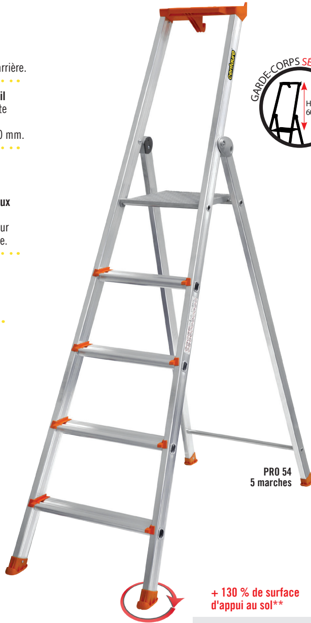
PRO 54 5 marches

Anti-soulèvement assuré naturellement grâce à la forme de la plate-forme.