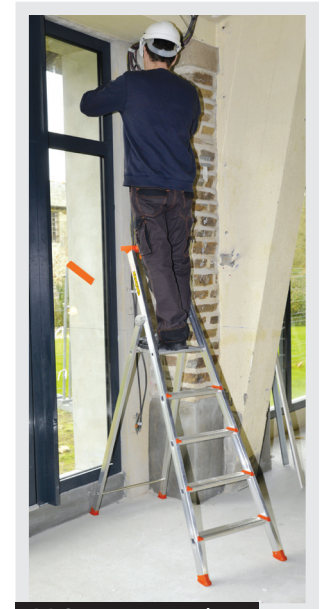
PRO 54 - 5 marches

TESTÉ À 260 KG TESTÉ DANS LES CONDITIONS DÉFINIES PAR LE PARAGRAPHE 5.8 DE LA NORME EN 131. CHARGE MAXIMALE D'UTILISATION 150 KG.