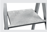
Plate-forme de travail antidérapante en fonte d'aluminium. Dimensions 250 X 250 mm.

Articulation haute résistance en fonte d'aluminium qui enveloppent le profil arrière.