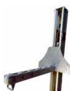
BINGO-SR Eperon rouleau 540 mm