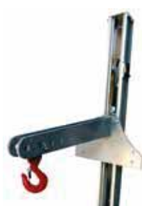
BINGO-G Eperon crochet 600 mm