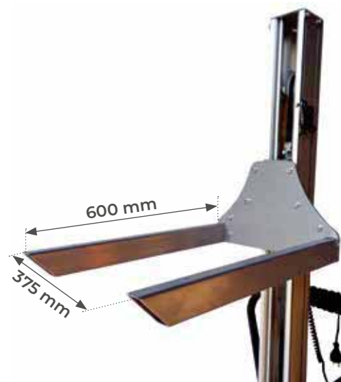
Equipé de série de fourches