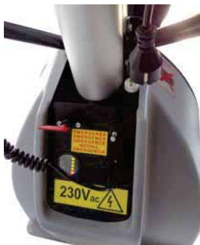
Tableau de commande avec chargeur intégré