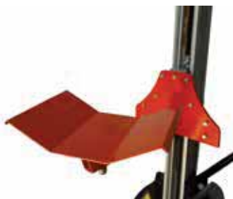
BINGO-BP Plateau en V 600 x 400 mm