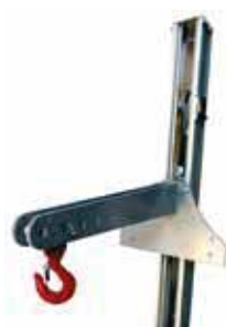
BINGO-G Eperon crochet 600 mm