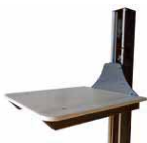
BINGO-P Plateau nylon 600 x 500 mm