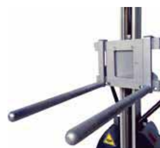
BINGO-DS Double éperon 600 mm