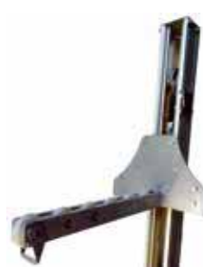
BINGO-SR Eperon rouleau 540 mm