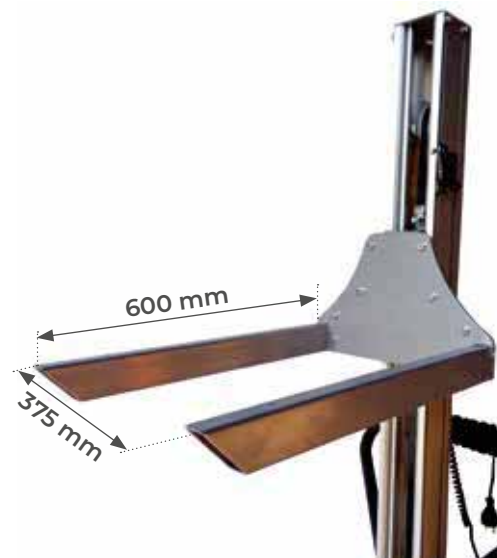
Equipé de série de fourches