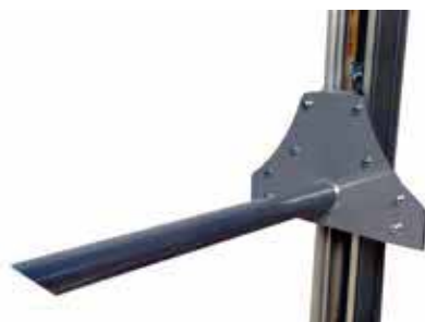
BINGO-S Eperon 600 mm