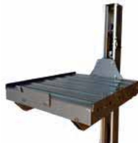
BINGO-C Convoyeur rouleau 600 x 500 mm