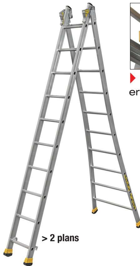
> 2 plans