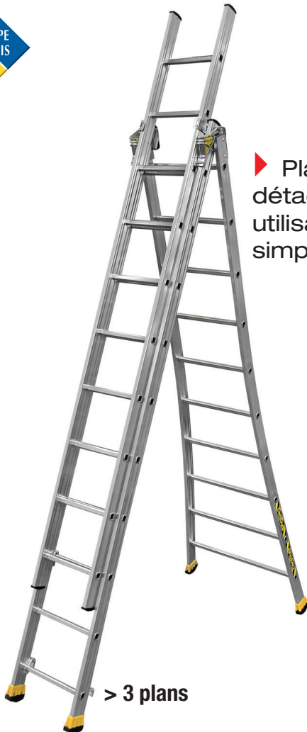
> 3 plans

► Plan supérieur détachable pour une utilisation en échelle simple**