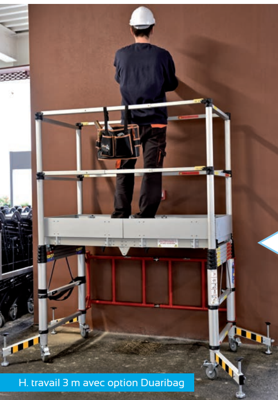
H. travail 3 m avec option Duaribag