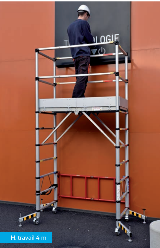
H. travail 4 m