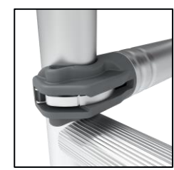
Liaison facile et sécurisée des garde-corps