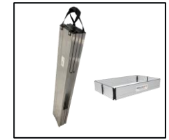
Pack de plinthes monobloc , léger et facile à transporter