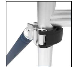
Installation rapide des stabilisateurs