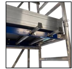
Supports d'aide au montage permettant d' accrocher le matériel