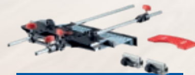
Adaptateur LO-FA pour défonceuse portable