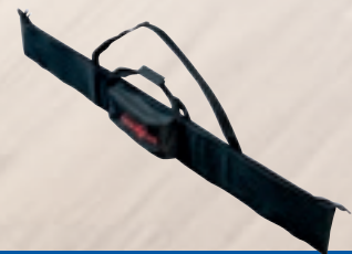
Housse de transport

Housse de transport F 160 pour rails de guidage jusqu'à 1,6 m de long