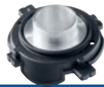
Bague de copiage Ø 24 mm