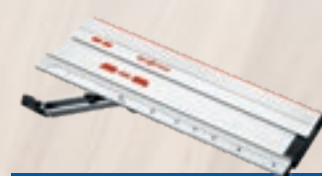
Butée angulaire F-WA