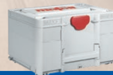
MAFELL MAX 3