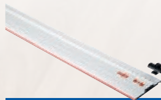
Rail de guidage LR