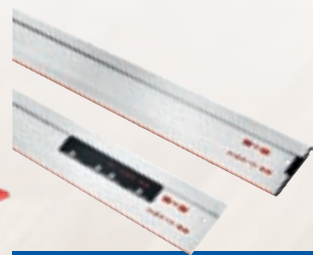
Rail de guidage F