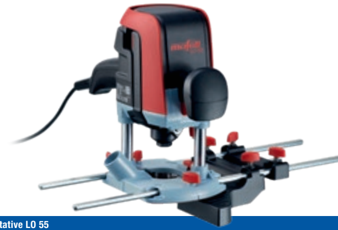
Défonceuse portable LO 55