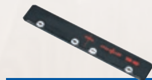
Pièce de raccordement F-VS