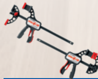
Serre-joints F-SZ 180MM

2 unités pour fixer le rail sur la pièce