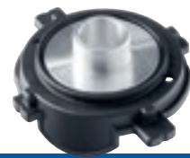
Bague de copiage Ø 17 mm