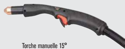
Torche manuelle 15°