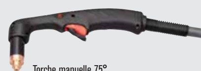
Torche manuelle 75°

(pour plus d'options de torche, consulter www.hypertherm.com )