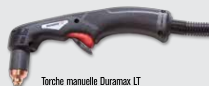
Torche manuelle Duramax LT