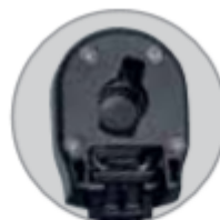
fixation à baïonnette uvex pheos K2P