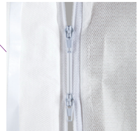
Double zip pour faciliter l'habillage et le déhabillage