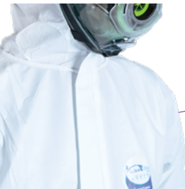
Rabat autocollant pour une étanchéité totale