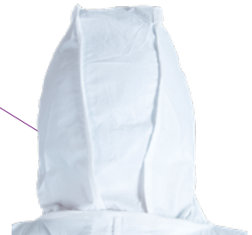
Capuche 3 pièces pour une liberté de mouvement