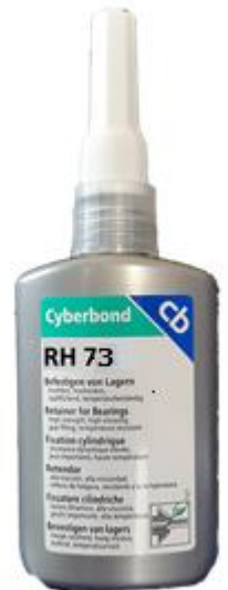
Flacon 50g Boîte x 10

ASTUCE : Pour réussir votre application, dégraissez parfaitement vos pièces avec le cleaner 9999 en aérosol 500ml