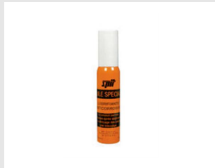
Eurocode 310080 Vaporisateur huile SPIT poudre 30ml