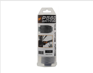
Eurocode 013955 Guide tampon monocoup P560