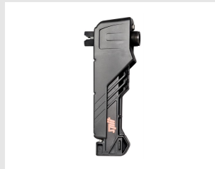
Eurocode 013952 Chargeur P560