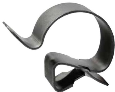
Clip bord de tôle