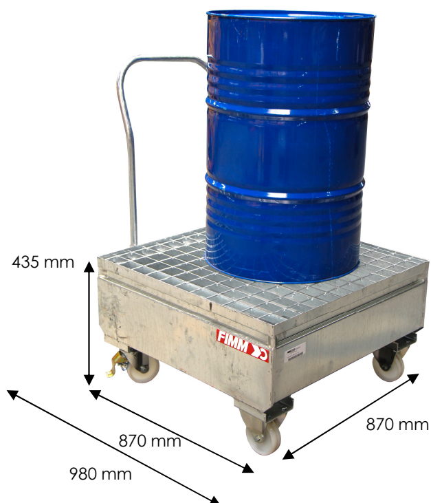
Chariot 1 fût 220 L 845006638

Dimensions HT : 980 x 870 x 1235 mm 44 kg