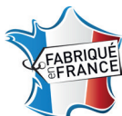
Caisse emboutie avec marquage "Made in France"