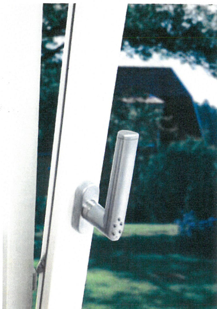
Mode aération (verrouillé ou déverrouillé)