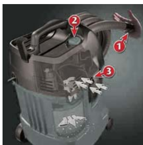
XC 27 : système "Push & Clean"