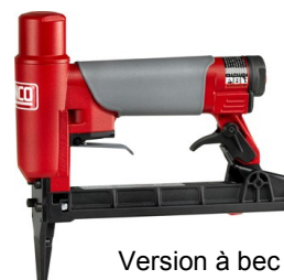
Version à bec long 50 mm