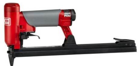
Version magasin double longueur (DL) = jusqu'à 390 agrafes