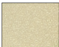
81 18 01 LUM

Elle s'applique sur les surfaces telles que : carrelage, marbre, parquet, etc... en zone sèche ou humide en intérieur. Sa surface agressive empêche les chutes causées par les glissades.