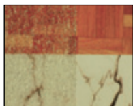
81 18 01 Transparent laisse apparaître la couleur du sol et sa texture.

Elles s'appliquent en intérieur en zone sèche ou humide et s'utilisent plus particulièrement pour sécuriser les ateliers et entrepôts.